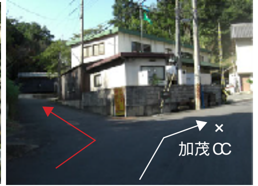
C 左折して少し登ると土日亭