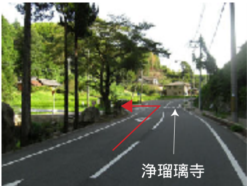
A 橋を渡る 加茂CCの看板方向へ進む